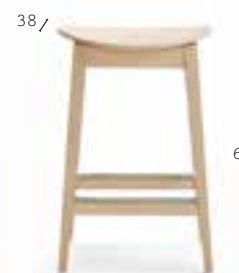
GRADISCA 626 4,4 kg 0,12 m 3 1 pz