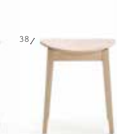
GRADISCA 617 3,5 kg 0,26 m 3 2 pz