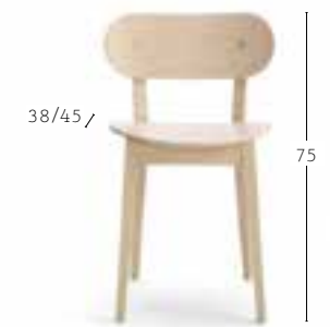
GRADISCA 620 4,5 kg 0,29 m 3 2 pz